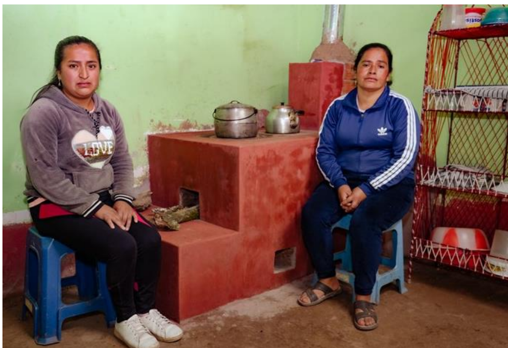
Beneficiaria de cocina mejorada en la Comunidad El Arenal - Cutervo

Al finalizar el programa, las 300 familias beneficiarias consumen 16 cargas de leña mensual en la preparación de sus alimentos, en promedio, habiendo reducido en 50 % la cantidad utilizada el iniciar el programa.