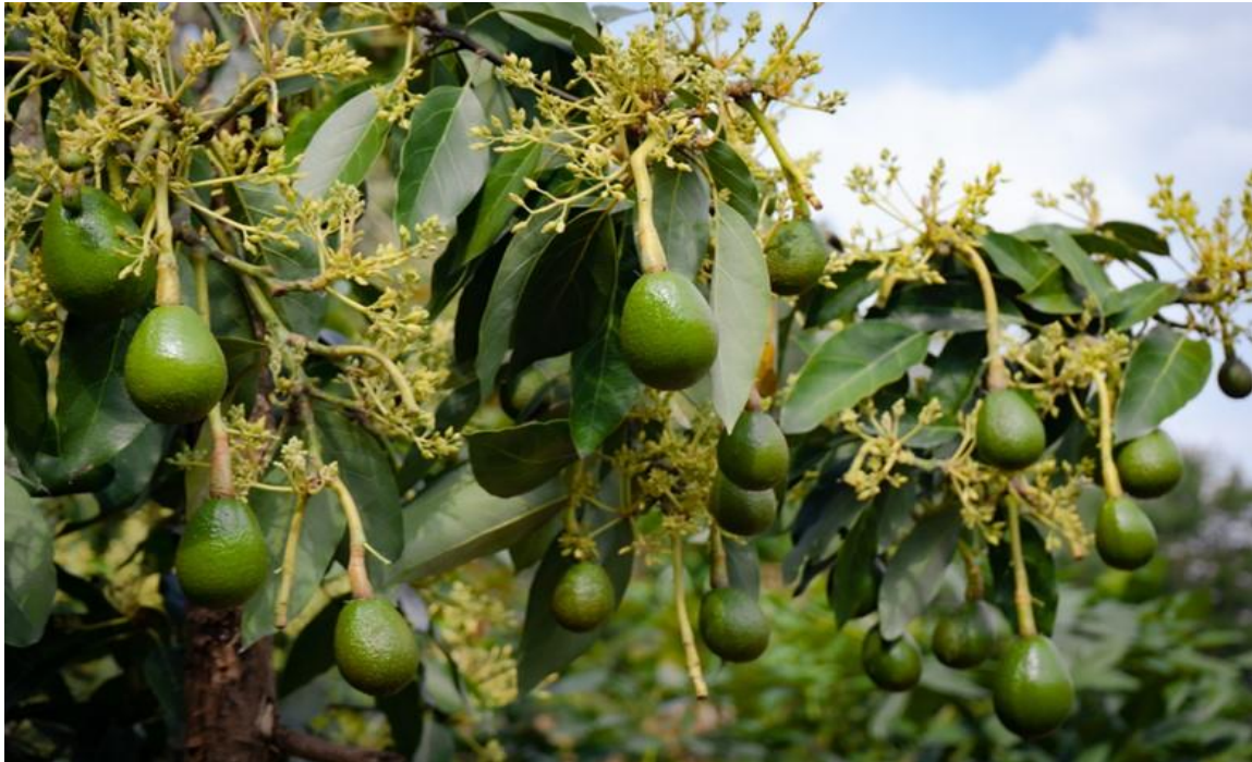
Plantación de palta, primera producción, en parcela de beneficiarios de la Comunidad El Cajerón

Para el desarrollo de estas actividades productivas, se han realizado 3 talleres, con participación de 90 productoras/es, los mismos han permitido fortalecer sus capacidades técnicas en diversificación productiva.