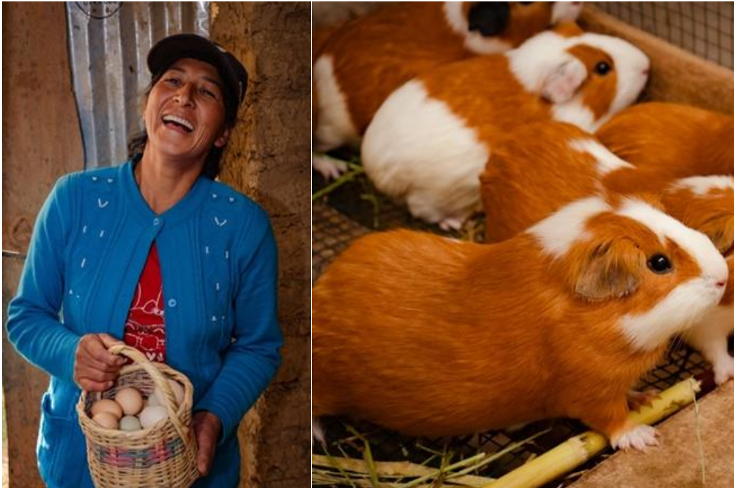
Crianzas y productos que se logran en los módulos de cuyes y gallinas ponedoras y generan ingresos a las mujeres. Comunidad de San Lorenzo

Al finalizar el tercer año de ejecución del Programa, las mujeres productoras participantes, incrementaron su ingreso promedio anual en 36 %, como resultado de las ventas de la producción agropecuaria, en sus emprendimientos productivos; principalmente la crianza de cuyes; alcanzando sus ingresos los S/ 2,709.00, en promedio.