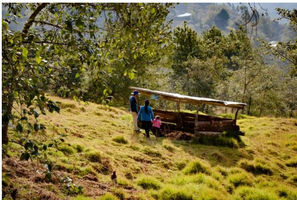
Módulo familiar de residuos sólidos y producción de humus de lombriz en parcela de familia beneficiaria en la comunidad de San Lorenzo

Para lograr este resultado, se instalaron 300 módulos de gestión de residuos sólidos familiares o micro rellenos sanitarios, con participación de las 300 familias beneficiarias. Esta actividad, se complementó con la ejecución de un programa de sensibilización y capacitación sobre adaptación y mitigación frente al cambio climático, realizándose 16 talleres, que se desarrollaron en distintas comunidades del ámbito de intervención y benefició a las 200 mujeres y 100 varones participantes del programa.