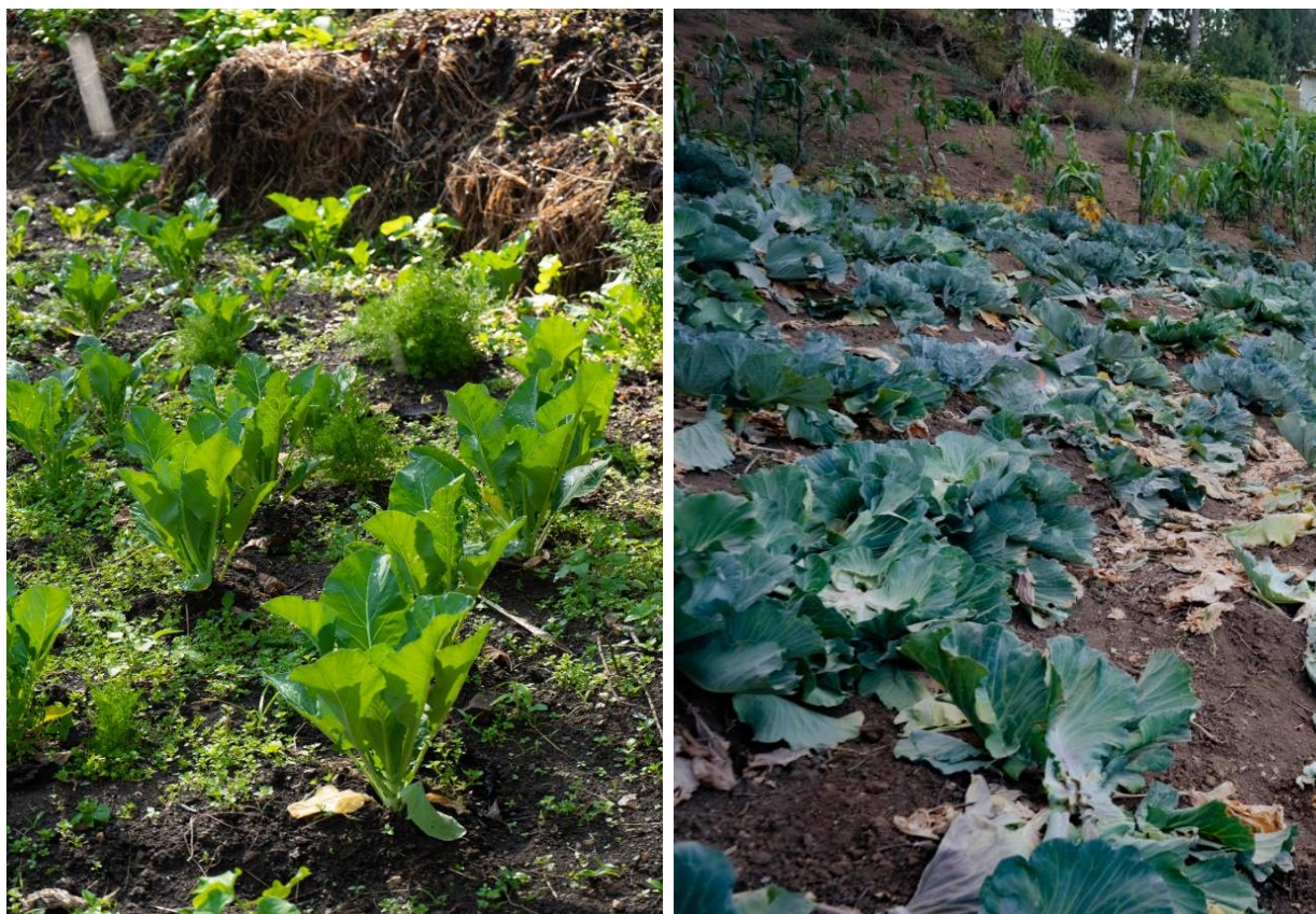
Huertos Hortícolas trabajados por beneficiarios/as en las comunidades de El Cajerón y San Lorenzo: Sembríos de acelga y de repollo en etapa de cosecha.

Asimismo, 112 mujeres (56 % de las beneficiarias) y 56 varones (56 % de los beneficiarios), al finalizar las campañas agrícolas, comercializan sus productos agropecuarios, de mayor importancia, en los mercados locales.