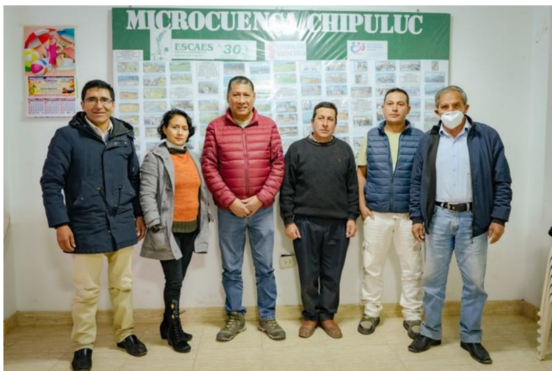
Integrantes del Equipo Técnico de ESCAES, ejecutor de las actividades de campo, junto al equipo evaluador del Programa

El equipo técnico de ESCAES que planificó ejecutó, en campo, las actividades del programa, estuvo constituido por técnicos de experiencia, residentes en la Región Cajamarca, conocedores de la realidad, costumbre y cultura de las comunidades rurales.