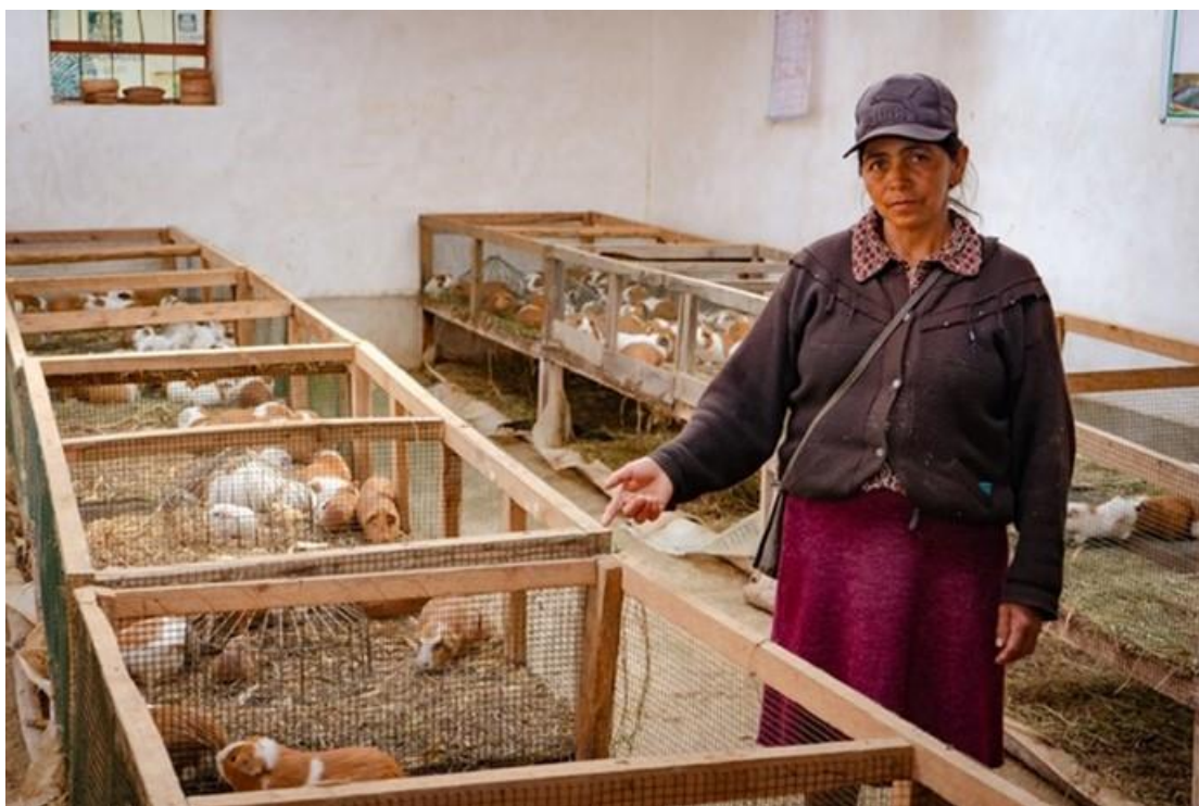
Beneficiaria del Programa, mostrando su módulo de cuyes, raza Perú, en la Comunidad de San Lorenzo.

beneficiando a 150 mujeres organizadas en grupos de tres mujeres por módulo. Cada módulo estuvo compuesto por 30 hembras y cinco machos. Para desarrollar su crianza adecuada, se instaló pastos mejorados, Cuba 22 y Rey gras ecotipo cajamarquino combinado con trébol rosado, Para cada módulo de cuyes, se ha instalado en un galpón de 50 m 2 , contraído con el aporte de materiales y mano de obra de las beneficiarias y beneficiarios; ESCAES apoyó con los materiales externos: calaminas, clavos, malla galvanizada, botiquines y medicamentos veterinarios, comederos, bebederos, gazaperas. Asimismo, capacitó y brindó asistencia técnica a los grupos de mujeres beneficiarias, en manejo adecuado de la crianza; quienes registran información del proceso productivo y comercial en fichas técnicas.