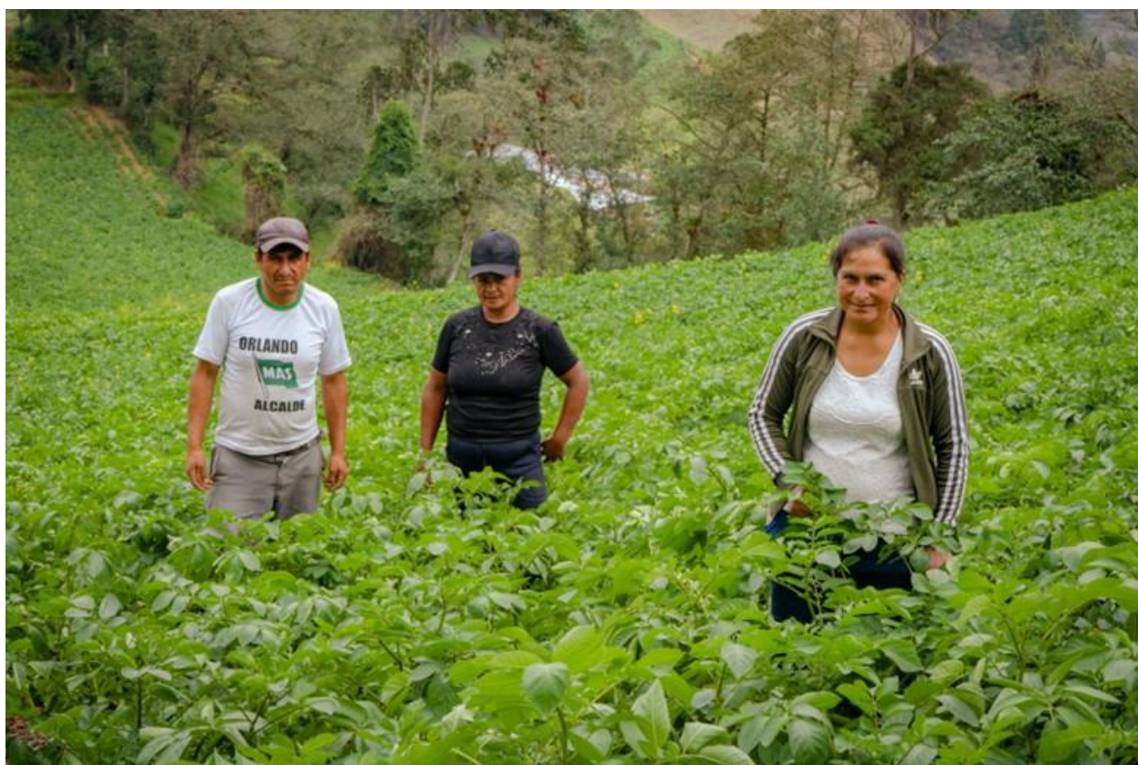
Productoras y productor de la Comunidad de El Cajerón – Cutervo, participantes en el Programa, en su parcela con cultivo de papa, que se desarrolla utilizando riego por aspersión.

En promedio, el incremento del rendimiento de los principales cultivos, alcanzó el 52.65 %, superando la meta establecida, que ha sido de 50 %.