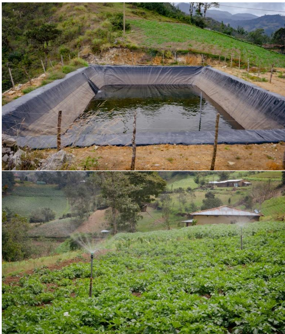
Microreservorio y líneas de riego por aspersión en cultivo de papa en parcela de beneficiarios en la comunidad El Cajerón.

Con la finalidad de generar capacidades en el manejo de los sistemas de riego instalados, se realizaron cinco talleres de capacitación sobre derecho al agua, dirigido a integrantes de los comités de usuarios de riego; igualmente, se desarrollaron cinco talleres de capacitación sobre administración, manejo y mantenimiento de sistemas de riego presurizado.