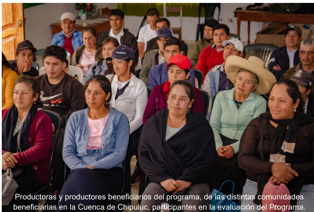
Productoras y productores beneficiarios del programa, de las distintas comunidades beneficiarias en la Cuenca de Chipuluc, participantes en la evaluación del Programa.

producción, habitantes de ámbitos rurales carentes de servicios básicos de calidad y de apoyo a la producción.