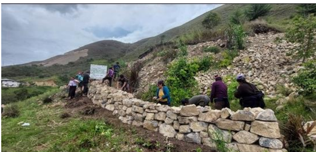
Terrazas de formación lenta construidas mancomunadamente en parcela de beneficiarios/as en comunidades del ámbito de intervención

Por otro lado, comités agro conservacionistas conformados en cada comunidad, con varones y mujeres beneficiarias, han identificado las zonas vulnerables a la erosión e implementas prácticas de conservación de suelos. Se elaboró un plan de trabajo y fichas técnicas para ejecutar esta actividad. En las diez comunidades, se han realizado estas prácticas en un total de 201.4 ha. Complementariamente, se instalaron 10 viveros, uno por comunidad, de 42 m 2 en las que se producen plántones de especies forestales nativas y frutales, para realizar agroforestería en las parcelas de los beneficiarios.