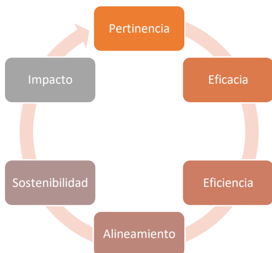
Ilustración 2 Cuadro de Evaluación de criterios

Para indagar sobre cada uno de estos razonamientos, se ha elaborado un cuestionario, el cual se aplicó de acuerdo con las características e involucramiento del actor social durante el desarrollo del proyecto.